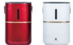
水素吸入器SS120-水素発生量120ml/min 水素純度99.99%