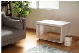
水素吸入器は別途必要となります。※SS120専用

コンパクトでインテリアの邪魔をしない「SUIPET」は、どんなシチュエーションでも設置しやすく、清潔感のあるデザインの水素ハウス用ケージです。